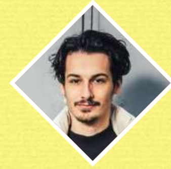
• Thibault Lauras Cameraman & Monteur